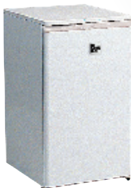
1 Réfrigérateur 110 L / Fridge