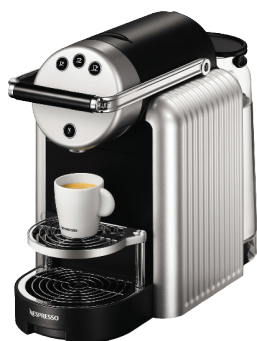
Machine à café / Coffee machine