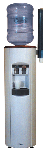
Fontaine à eau / Water cooler